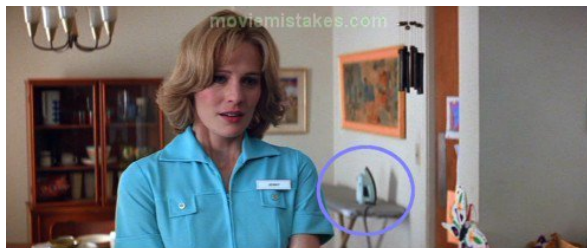
Forrest Gump Iron moves