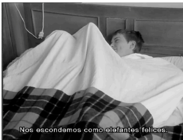
“Al final de la escapada” (1959). Godard.

Otros tipos de montaje frecuentes que podemos encontrar serían los siguientes: