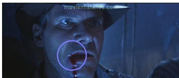
Indiana Jones and the Last Crusade Blood switches sides