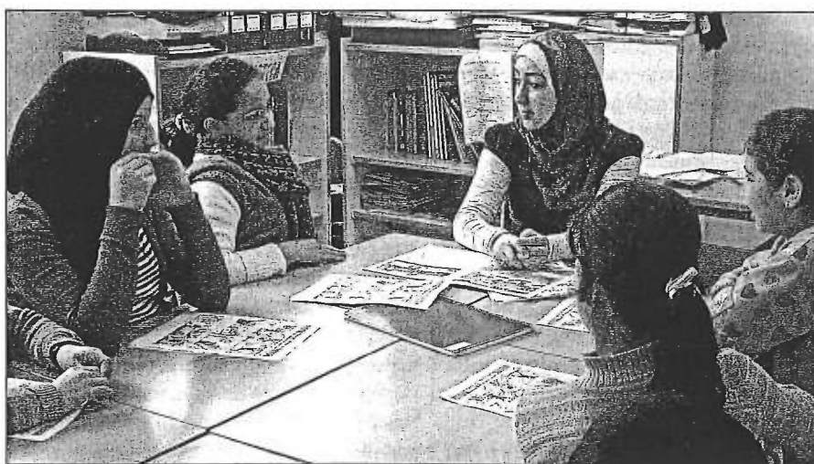
Escola Mare de Déu de Montserrat (Terrassa)

SANDRA GIRBÉS PECO / Equipo de Comunidades de Aprendizaje CREA-UB