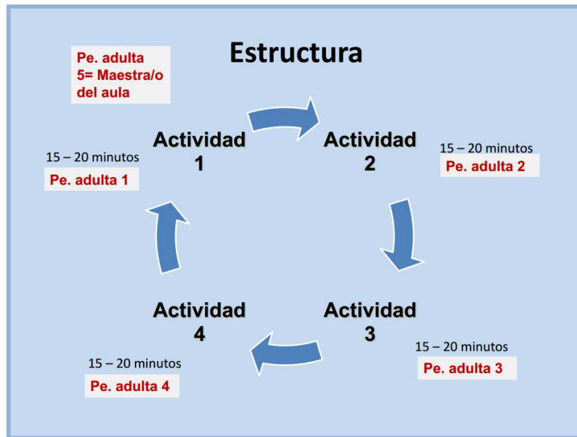
Figura. Estructura de funcionamiento de los grupos interactivos