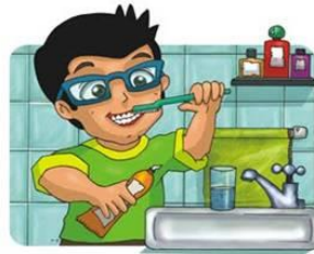
Lavarse los dientes