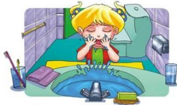
Lavarse la cara