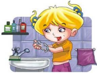
Lavarse las manos