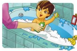
Bañarse a diario