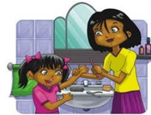
Cortarse las uñas

3º) Responde a las siguientes preguntas: (Responde con respuestas largas)