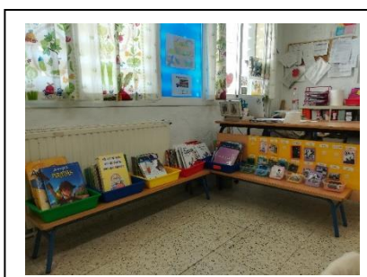
BIBLIOTECA DE AULA

Esto nos sirve para que otros compañeros y compañeras sepan de qué trata cada cuento y tengan más opciones para elegir, puesto que muchos de ellos eligen en función del dibujo de la portada.