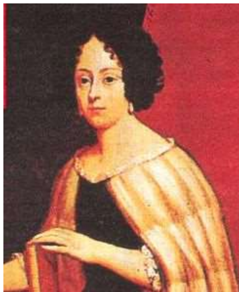
Retrato de la autora del siglo XVII