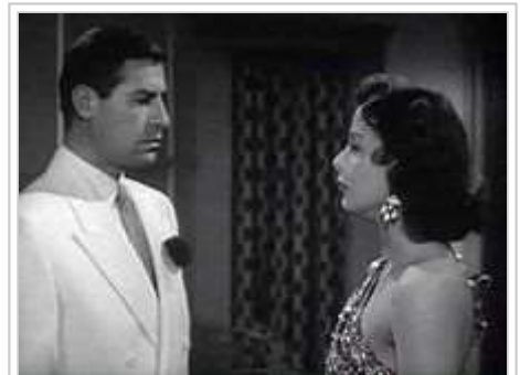
John Hodiak y Lamarr en A Lady Without Passport (1950)

Así renació, pues volvió de nuevo a su vida como actriz. Había hecho hasta entonces, además de la película checoslovaca Éxtasis , cuatro películas alemanas, además de la citada: Dinero en la calle (1930), La mujer de Lindenau (1931), Las aventuras del señor O. F. (1931), y No necesitamos dinero (1932). Gracias a su fama, le fue posible viajar a Hollywood, donde sería protegida por Louis B. Mayer quien además, le daría un nuevo nombre inspirado en la actriz Barbara La Marr, antigua amante de Louis, que falleció en trágicas circunstancias.