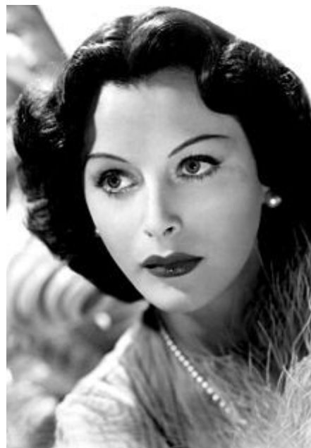
Hedy, en 1948.