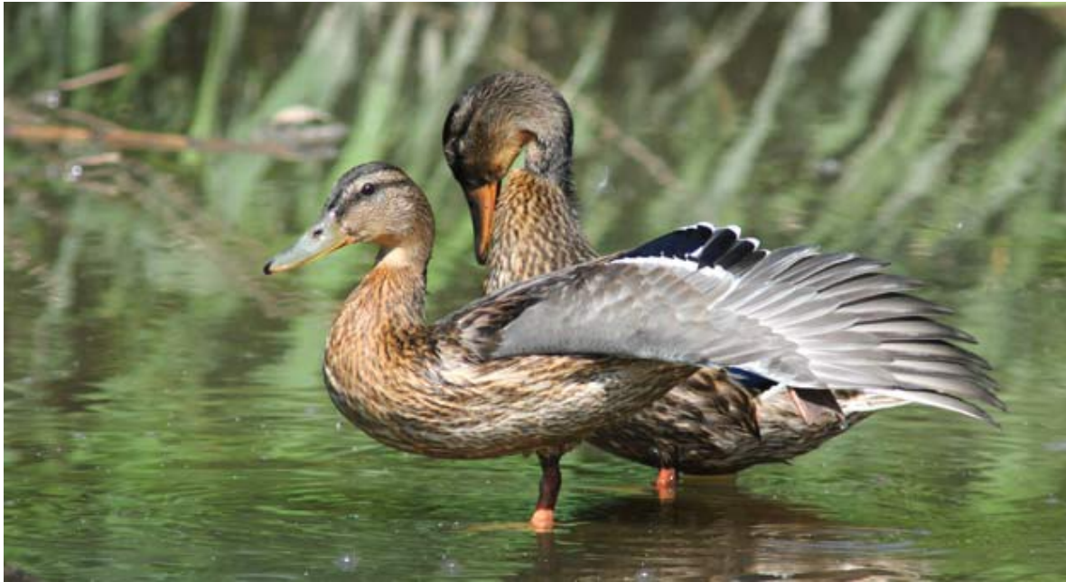
Ánade azulón ( Anas platyrhynchos )

Su cualidad biológica y ambiental reside en ser refugio de numerosas especies de aves, anfibios y presentar una vegetación propia de humedales, pero que al estar situada a casi un millar de metros de altitud, posee características muy especiales.