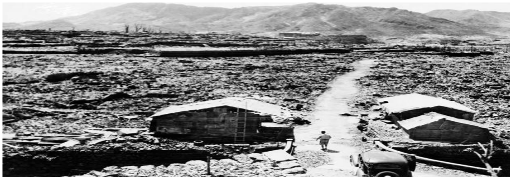
Fotografía tomada en de septiembre de 1945 en Hiroshima, un mes después de la explosión de la bomba

Seis días después de la detonación sobre Nagasaki, el 15 de agosto, el Imperio de Japón anunció su rendición incondicional frente a los «Aliados», haciéndose formal el 2 de septiembre con la firma del acta de capitulación. Con la rendición de Japón, concluyó la Guerra del Pacífico y por tanto, la Segunda Guerra Mundial. Como consecuencias de la derrota, el Imperio nipón fue ocupado por fuerzas aliadas lideradas por los Estados Unidos —con contribuciones de Australia, la India británica, el Reino Unido y Nueva Zelanda— y adoptó los «Tres principios antinucleares», que le prohibían poseer, fabricar e introducir armamento nuclear.