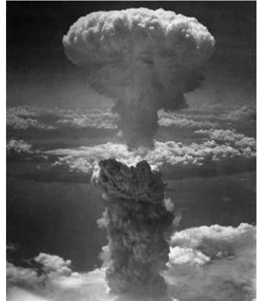
La bomba atómica hace explosión en Nagasaki

Los bombardeos atómicos sobre Hiroshima y Nagasaki fueron ataques nucleares ordenados por Harry S. Truman, presidente de los Estados Unidos, contra el Imperio del Japón. La bomba Little Boy fue arrojada a las 08:15 horas del 6 de agosto de 1945 en Hiroshima y la bomba Fat Man fue lanzada el 9 de agosto a las 11:02 de 1945 en la ciudad de Nagasaki. Esto forzó la rendición de Japón y el fin de la Segunda Guerra Mundial, después de seis meses de intenso bombardeo. 105 000 y 120 000 personas murieron y 130 000 resultaron heridas. Hasta la fecha, estos bombardeos constituyen los únicos ataques nucleares de la historia.