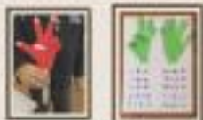
Descomposición 10 y 10